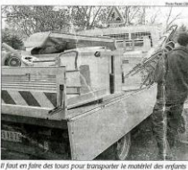
Le jour de la livraison pour transporter le matériel des enfants

Gainant. Elles sont pourtant six en CDI (deux éducatrices, trois assistantes de puériculture et une aide maternelle, auxquelles il faut ajouter trois personnes en contrats aidés. « Il est clair que nous ne pouvons embaucher davantage », souligne en chiffres de poids de la masse salariale : 129 000 € et un budget de 152 000 €. « Il reste peu pour des investissements mais nous mettons toujours une enveloppe de 7000 € chaque année pour acheter de nouveaux jouets et à un an. » A l'extérieur aussi, les petits ont l'occasion de s'amuser, grâce à la cour d'école et au grand terrain à l'arrière. « Avec les parents, ils plantent et récoltent des légumes. Avec les parents, ils peuvent ramener à la maison. » C'est là un exemple parmi les nombreuses activités que propose le centre. Pour tous les parents, adhérents ou non à l'association, le Relais des petits propose une dizaine de rendez-vous par semaine. Il s'agit d'attirer les enfants mais, avec des intervenants extérieurs spécialisés, autour du langage de l'enfant, musical ou de la lecture. En septembre et en octobre, il organise aussi des conférences. La prochaine se déroulera ce jeudi 27 mars, à 20 h 30 au Palais des congrès de la commune, l'assemblée générale de la communauté de communes. « Mais les employés sont contents de travailler toujours plus de demandes », indique Cécile