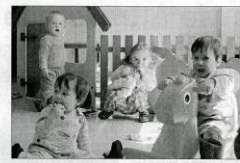
Chaque année, les petits découvrent de nouveaux jouets grâce à une somme réservée à leur renouvellement.

Le Relais des petits qui héberge une halte-garderie et une crèche parentale a bien du mal à faire face à la demande. 137 familles adhèrent à cette association où toutes s'investissent.